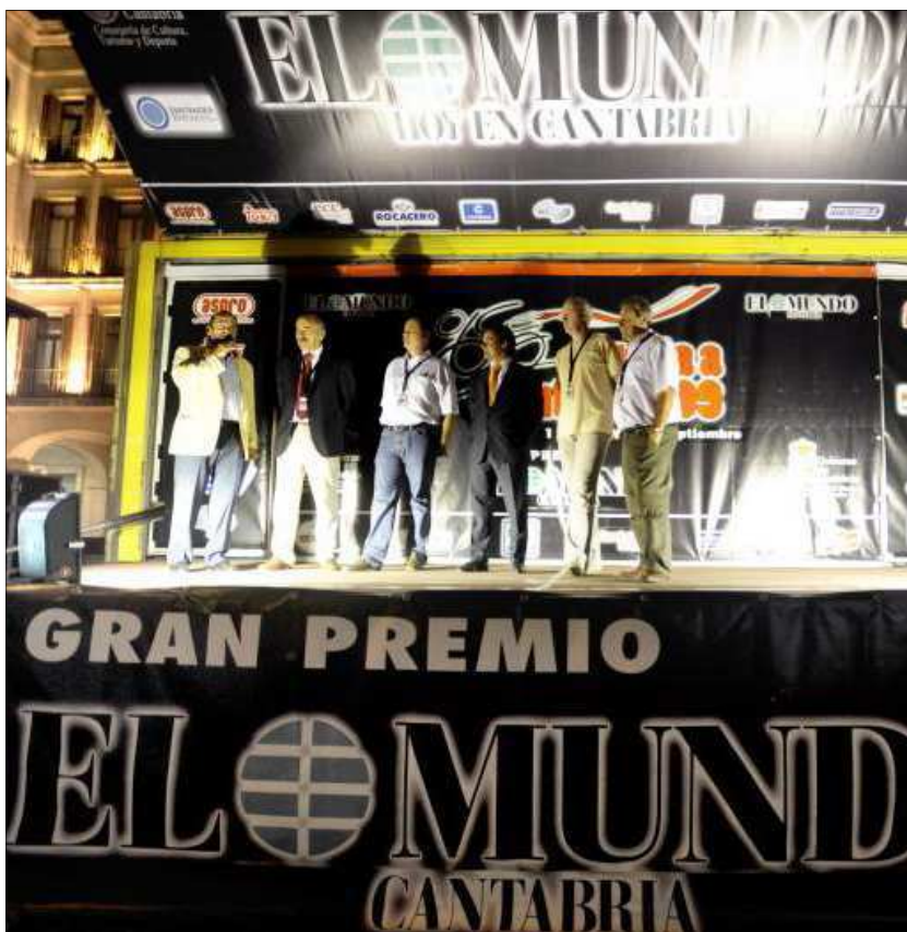
Un momento de la presentación de la prueba en pleno centro de Santander.