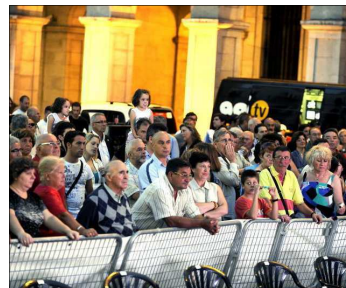
El público, durante la presentación.

Y la segunda etapa será completamente inversa a la segunda. 149 kilómetros separarán la salida en Torrelavega de la llegada en Villaverde de Pontones. Y será diferente por dos motivos. El primero porque los equipos habrán descargado los nervios con los que se han desplazado a Cantabria. Y el se-