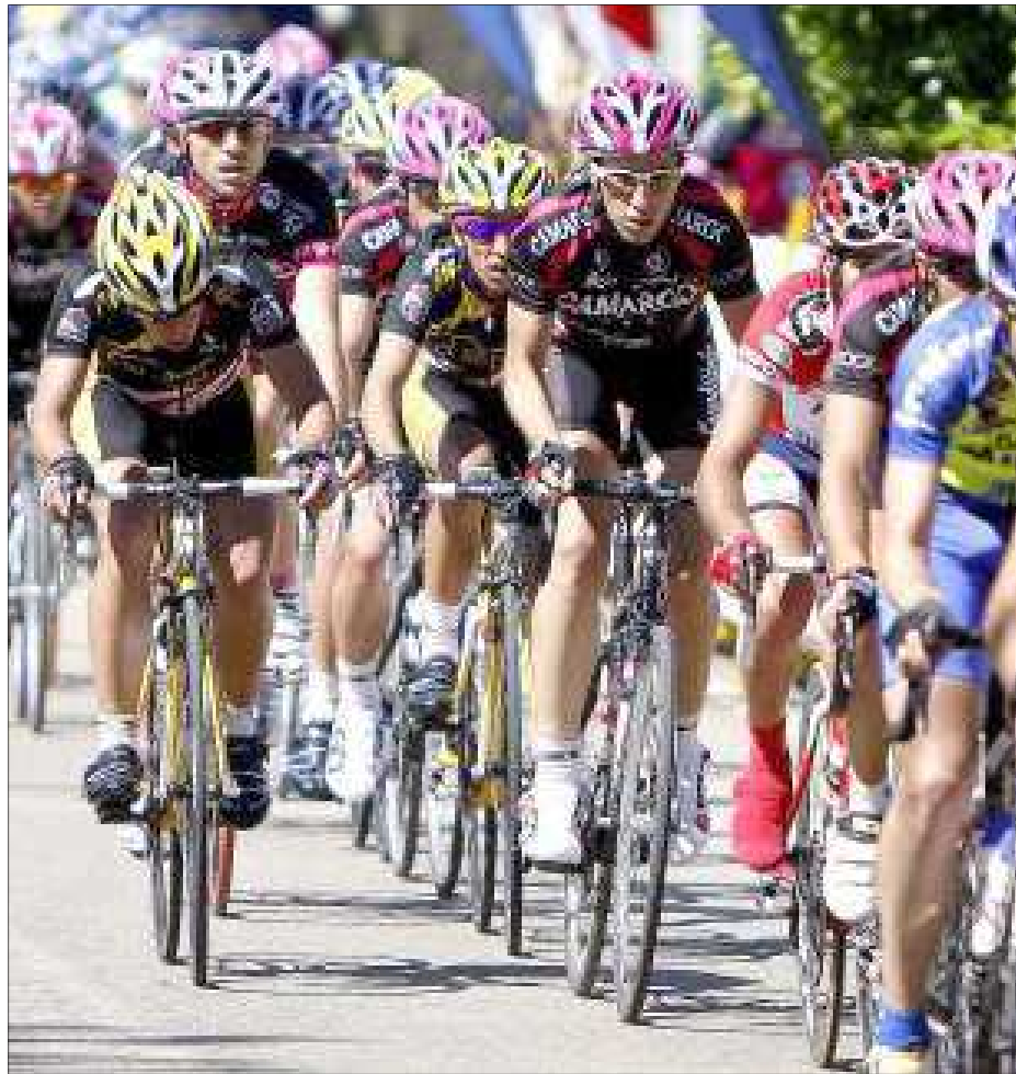
Los equipos cántabros esperan tener un gran protagonismo durante este fin de semana.

por ello menos importante, es el Trasmiera Fuji, que a su vez es el filial del Fuji Servetto, que en estos momentos está disputando la Vuelta a España con gran presencia tanto en las escapadas de cada día como en las clasificaciones menores. Los nuevos patrocinadores sus-